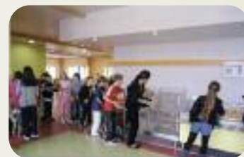
Le Département financeur du nouveau restaurant scolaire du groupe scolaire du Square Castle Donington, à Gasny.