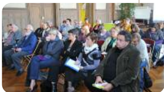
A Vernon, lors d'une des quatre rencontres territoriales ayant précédé les Assises départementales des solidarités.