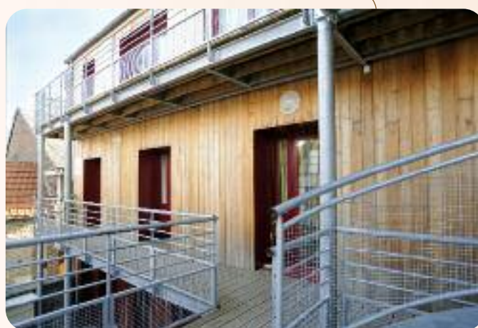
Le Prieuré, un ensemble de logements Eure Habitat à Pont-de-l'Arche.