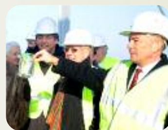
La mise en eau du centre de traitement des eaux usées de l'agglomération d'Evreux à Gravigny.

L'année 2012 verra le déroulement de la révision en deux temps du Plan climat énergie départemental.