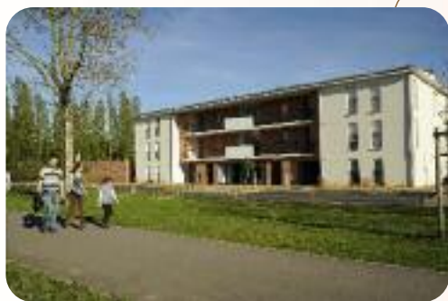
Des logements Eure Habitat aux Falaises (Val-de-Reuil)