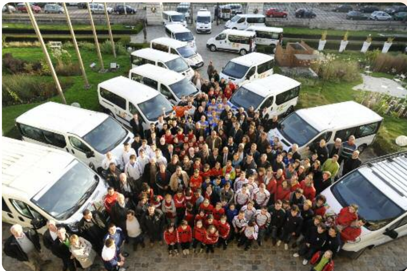
La remise des véhicules du "276 ça roule" aux clubs et comités sportifs de Haute-Normandie.