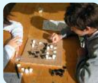
Animations autour des jeux gallo-romains à Gisacum.