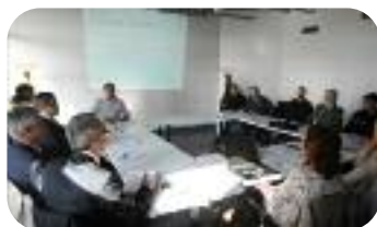
Un important chantier d'insertion a été mené pour la construction de la Maison département des solidarités à Evreux-La Madeleine.

L'effort porte aussi sur l'économie sociale et solidaire , (9% des emplois haut-normands, 51 000 personnes concernées), avec notamment le soutien au dispositif local d'accompagnement (DLA) qui permet de pérenniser des emplois associatifs. Le Département a par ailleurs mis en place un dispositif de microcrédit départemental pour accompagner les crédits de l'ADIE (association pour le droit à l'initiative économique).