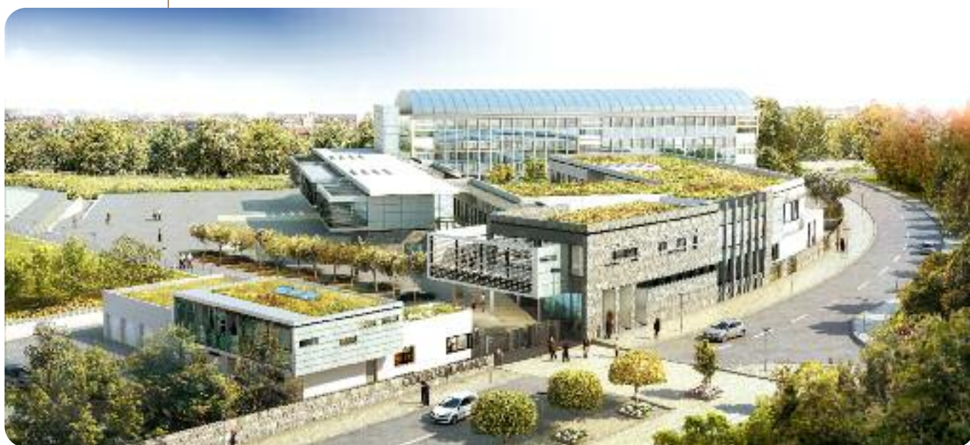
Une perspective du futur collège Maurice-de-Vlaminck, à Verneuil-sur-Avre.