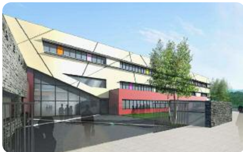
Une perspective du futur collège Marie-Curie, à Bernay