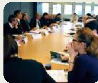
Lors de la cérémonie de validation du SAGE de l'Iton, à l'hôtel du Département.

12 M€ seront engagés pour des nouveaux projets d'équipement d'assainissement collectif entre 2010 et 2015.