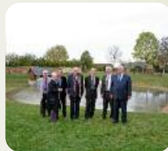
Réaménagement d'une mare à Claville.

Un premier projet de maison de santé est sur le point de voir le jour à Gaillon.