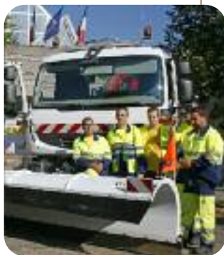
Un des engins de la direction des routes utilisé pour la viabilité hivernale des routes de l'Eure.

Poursuite des travaux de la déviation de Gisors financée à 100% par la Région