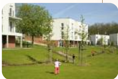
La résidence de l'Artois (Eure Habitat) à Evreux-Saint-Michel.