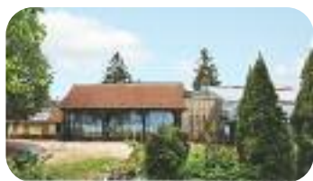
La Maison du Tourisme de l'Eure en cours d'aménagement à Giverny.