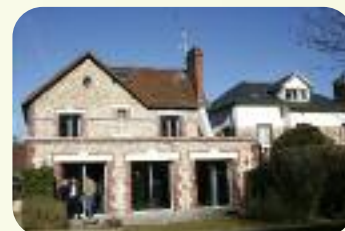
La Maison pour adolescentes d'Evreux, ouverte en septembre 2011.

En 2012, le Département pourra s'appuyer sur de nouveaux équipements comme la Maison pour adolescentes, ouverte en septembre 2011