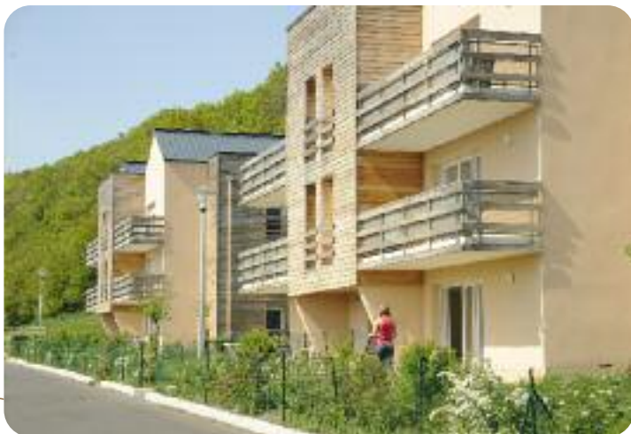
Garden Cottage (Pont-Audemer), une réalisation d'Eure Habitat.