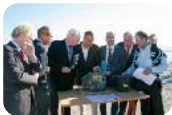
Pose de la première pierre de la serre Biotropica à Poses.

Pour 2012, le Département mobilise des moyens autour d'un programme important en matière de recherche appliquée, de recherche de références ainsi qu'un dispositif de soutien à l'innovation technique.