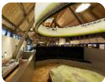
Le centre d'interprétation du site gallo-romain de Gisacum, au Vieil-Evreux.