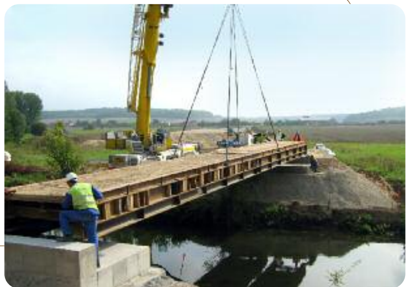
Pose d'un tablier provisoire pour traverser l'Epte sur le tracé de la déviation de Gisors.