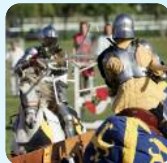
Joutes chevaleresques au domaine d'Harcourt.