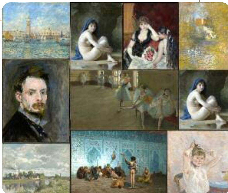
Quelques-uns des tableaux de l'exposition de la collection Clark "De Monet à Renoir" qui a connu un grand succès en 2011 au musée des impressionismes Giverny.