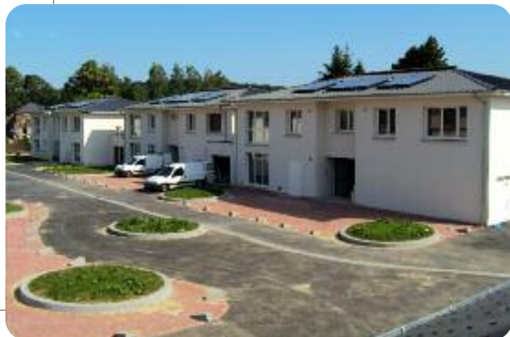
Des logements Secomile à Bézu-saint-Eloi.