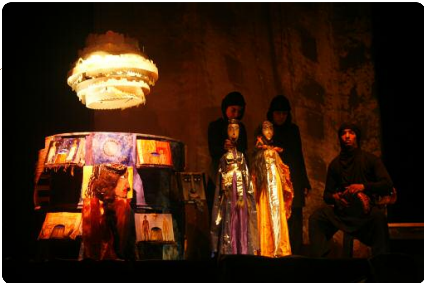
Le Théâtre d'Illusia, en résidence à Harcourt depuis l'automne 2010 et jusqu'aux Séquences 2012.