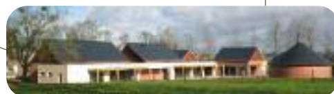
Des accueils petite enfance à Saint-Ouen-de-Thouberville (en haut) et à Bourg-Achard.