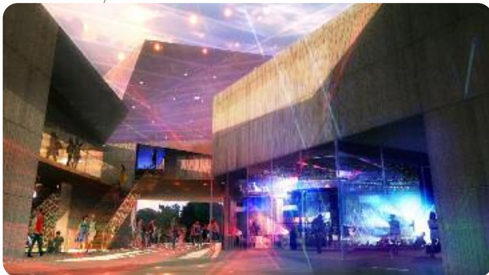
La future Salle des musiques actuelles de l'agglomération d'Evreux.