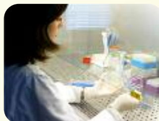
Ces images illustrent le soutien du Département aux trois pôles de compétitivité et technopôles de l'Eure, la technopole Chimie-Biologie-Santé (CBS), Valmaris Technopole et Cosmetic Valley.